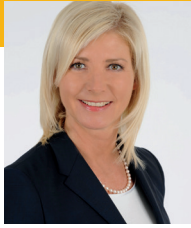
Ulrike Scharf MdL

Bayerische Staatsministerin für Umwelt und Verbraucherschutz