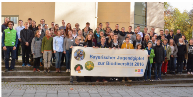
Jugendgipfel 2016

Um eine verbindliche Anmeldung bis 6. November 2017 unter jugendgipfel@pan-gmbh wird gebeten.